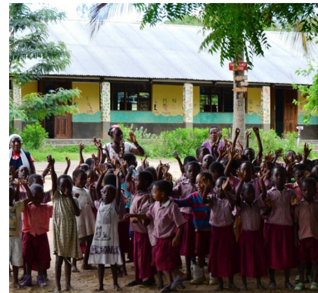
Bambini e maestre al Tabasamu Centre

Sabato e domenica sono dedicati al riposo/escursioni