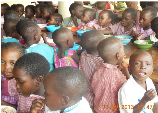
Bambini alla mensa del Tabasamu Centre

AIFI Lombardia prosegue l'azione a sostegno di questa iniziativa anche attraverso la promozione di attività di volontariato da parte di fisioterapisti presso il nuovo reparto fisioterapico all'interno del Tabasamu Centre.